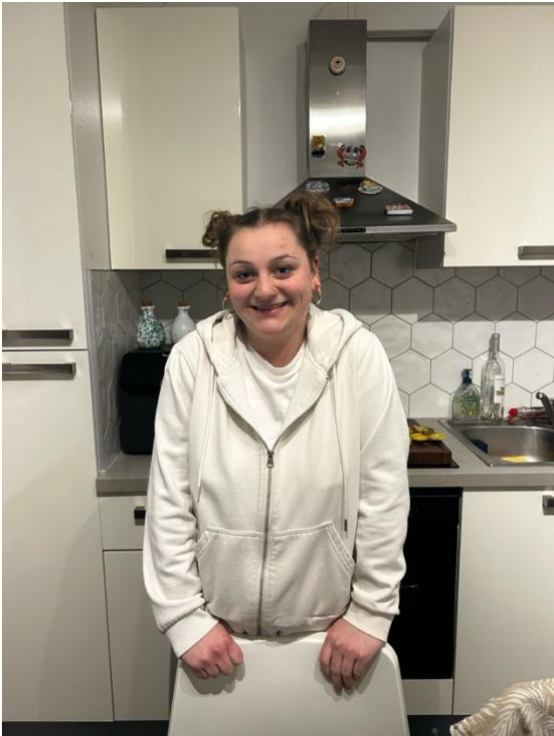
Photo de la personne interviewée prise lors de l'entretien en présentiel (07/03/26)